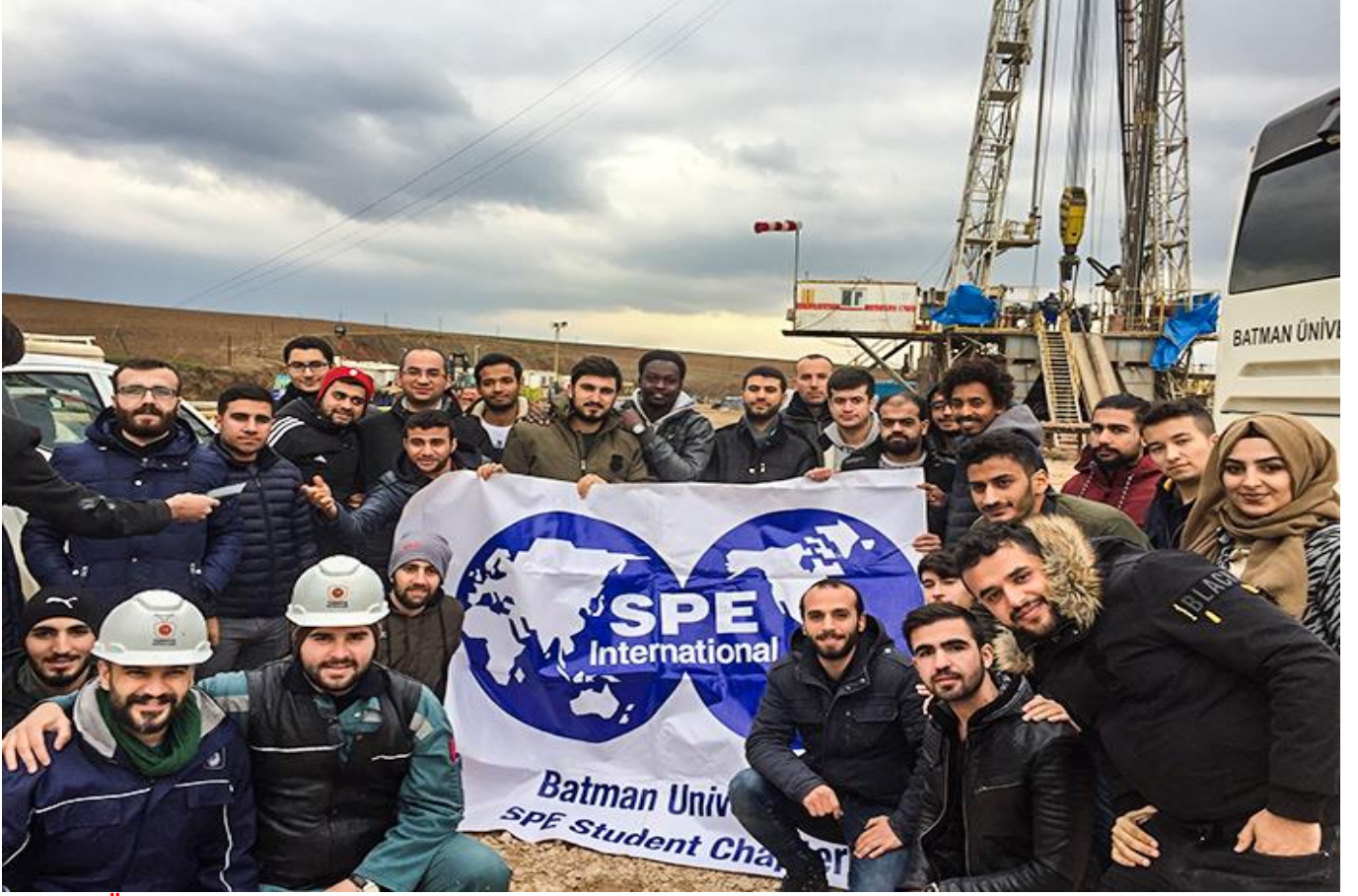
Batman Üniversitesi Ailesi 23 Nisan Ulusal ve Egemenlik ve Çocuk Bayramı'nı kutladı